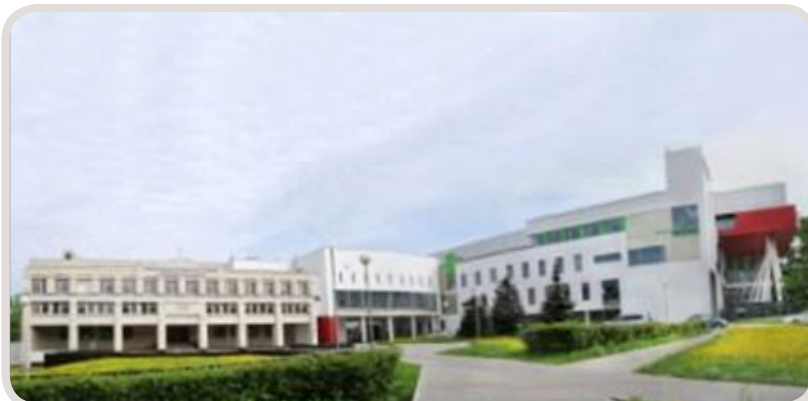
Корпуса НОУОР 2016 год