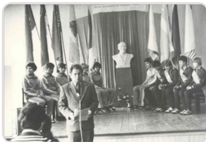
Открытие музея спорта (1981 год)