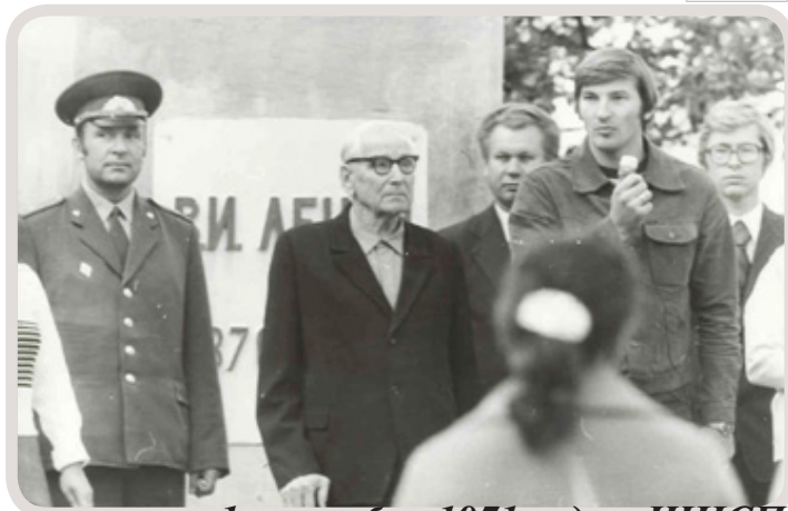
1 сентября 1971 года в ШИСП

Создавалось наше училище в 1971 г. как школа-интернат спортивного профиля (сокращённо – ШИСП), новый тип образовательных учреждений в то время, основной задачей которых стала подготовка олимпийского резерва сборных команд страны.