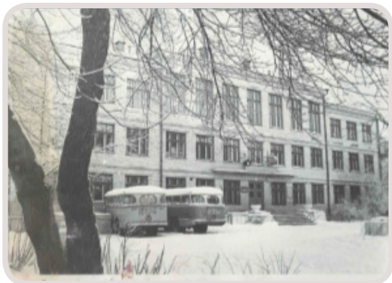
Здание ШИСП 1971 год

Рассматривая старые фотографии, думаешь, как много изменилось. Изменились здания, повзрослели дети, сменился уровень жизни и восприятие прекрасного. Но не изменилось лишь одно – наша любовь к спорту!