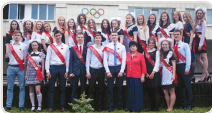
Выпуск 2016 год