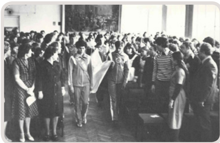
Посвящение в юные спортсмены