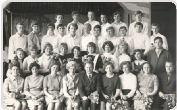
Выпуск 1971 год